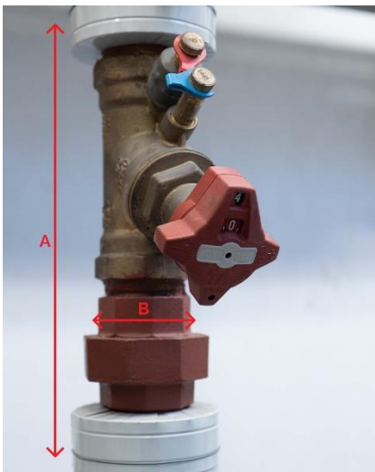
Figuur 1: Appendage